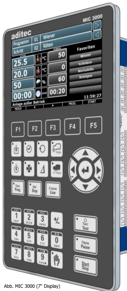
Abb. MIC 3000 (7" Display)

Le programme de maintenance pratique, piloté par menu pour la configuration de base, c.à d. paramétrage libre des relais, des processus, des étapes du programme et des programmes utilisateur avec appellation libre sous WIN7 / 8.0 / 8.1 / 10 / Server 2008 / Server 2012.